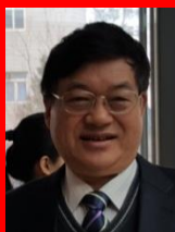
刘保延 教授 医学博士 世界针灸联合会 (WFAS)主席